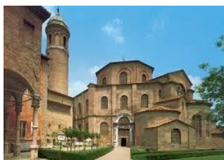
Basilica di San Vitale - Esterno