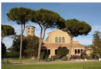
San Apollinare in Classe - Esterno