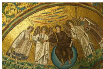
Basilica di San Vitale - Abside